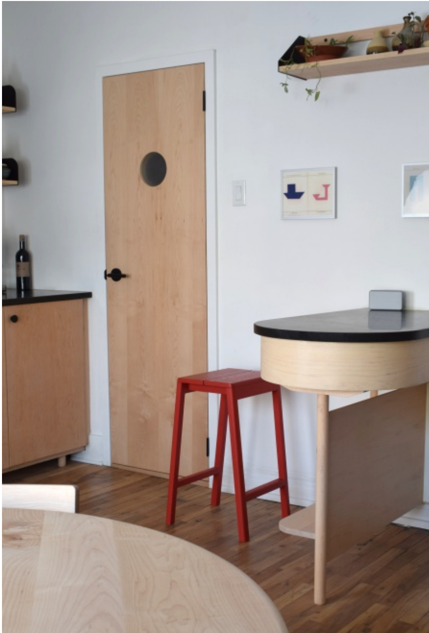
Cabinets et Porte sur mesure