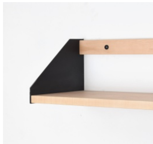
Tablette Plates & Planks