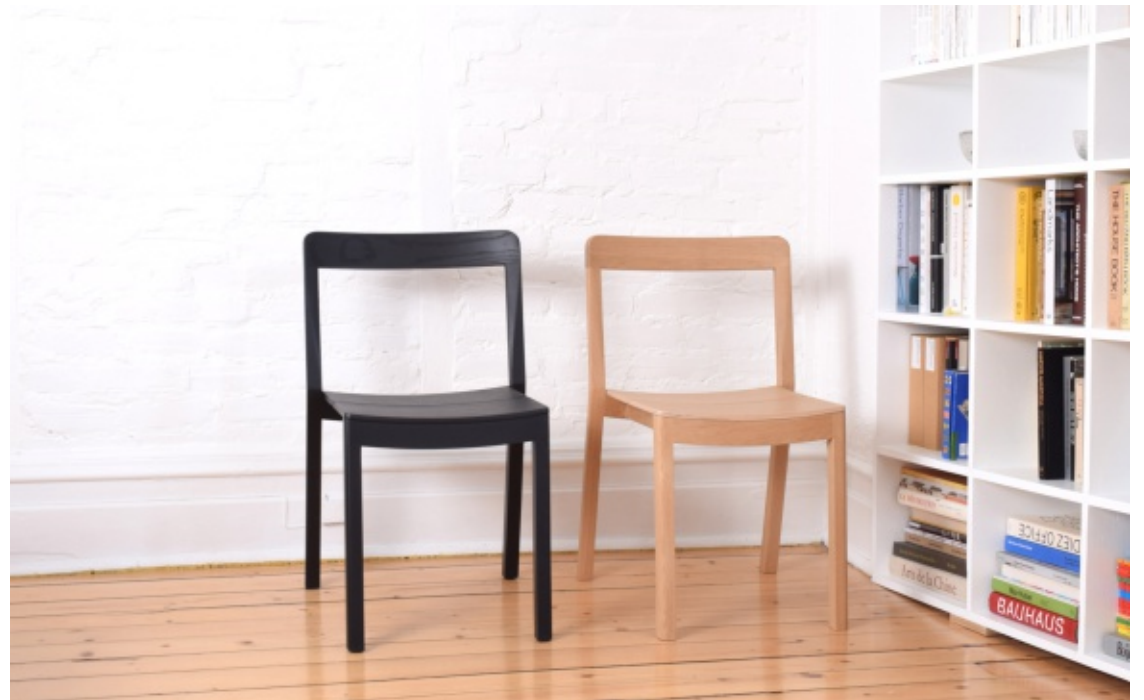
Chaises Same, Same