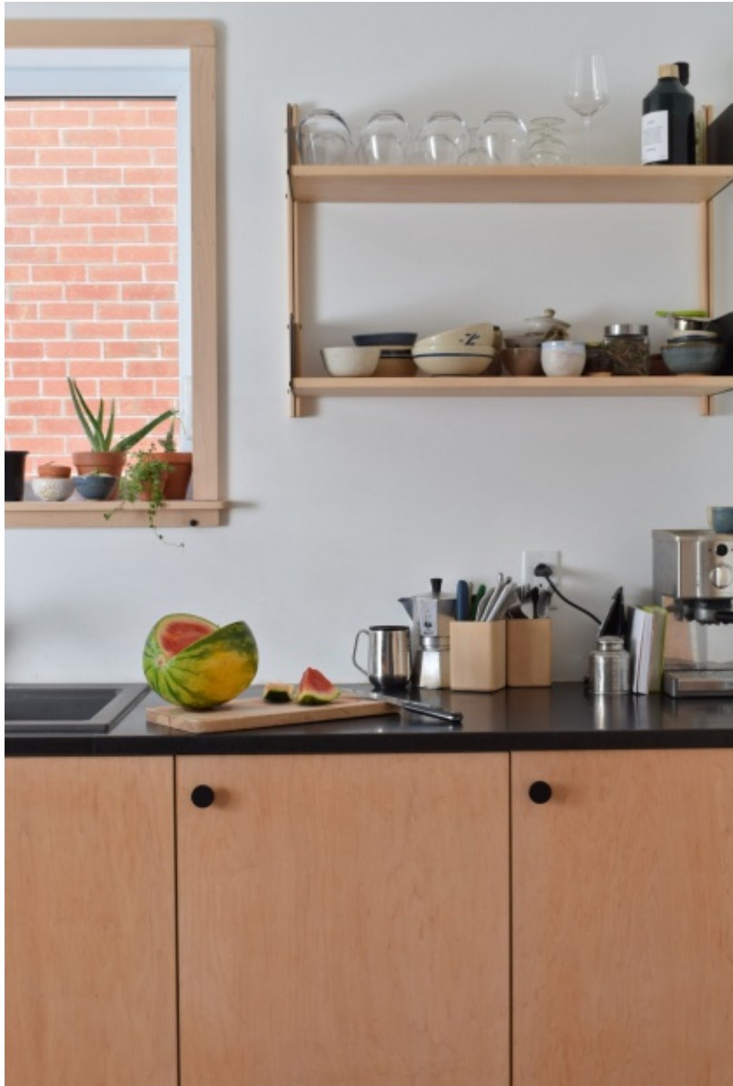
Cabinets sur mesure