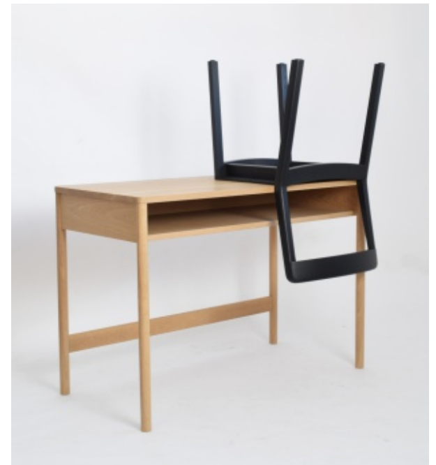
Bureau sur mesure et Chaise Same, Same