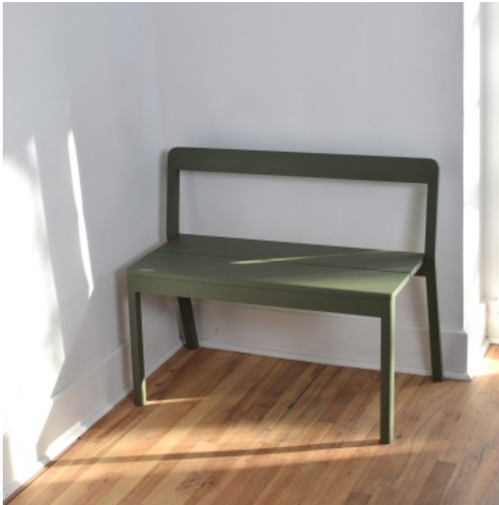
Banc Same, Same