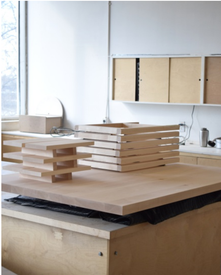
llôt sur mesure et tabouret comptoir