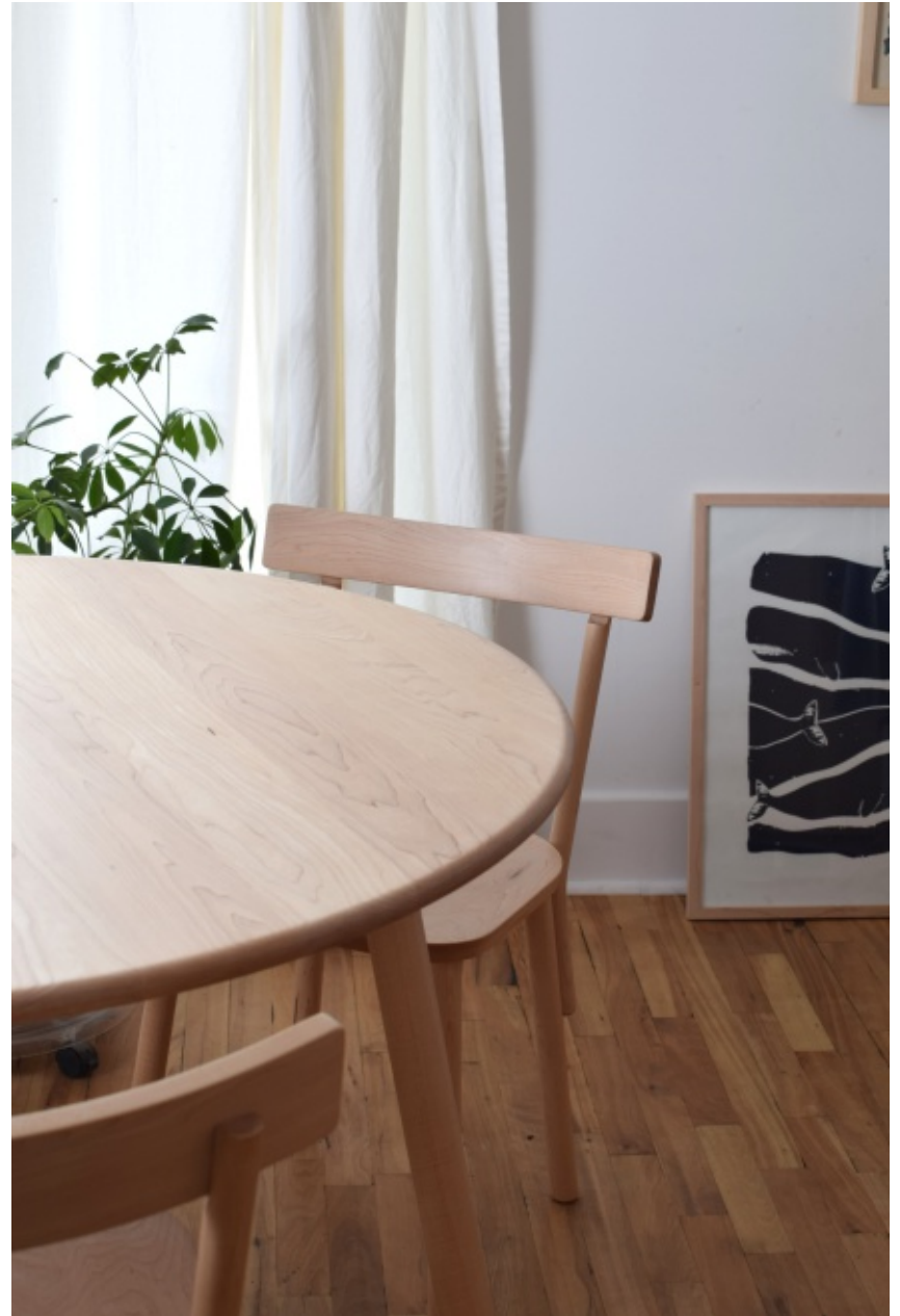
Table Gentle et chaises 1+1