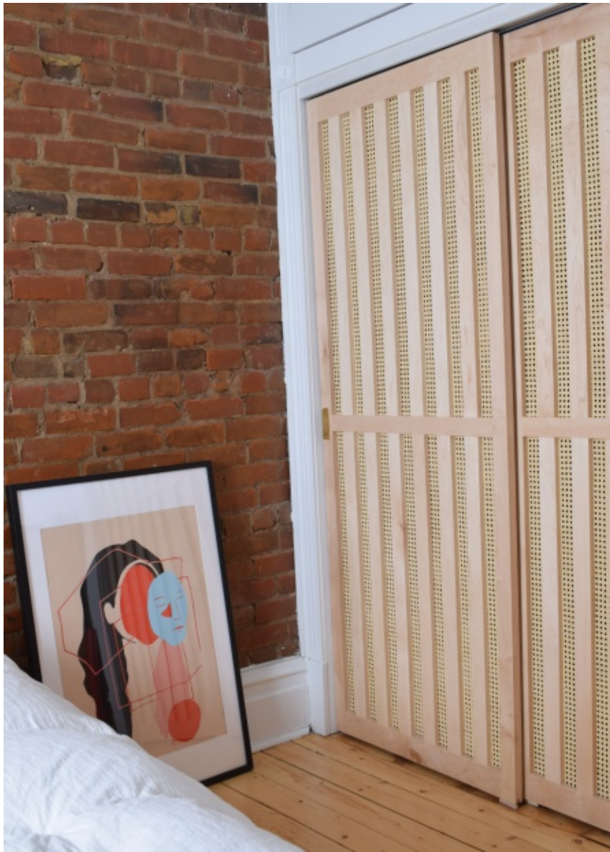
Portes sur mesure